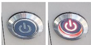
■スイッチでのON/OFF可能 (ONのみの選択可)